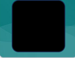
令和8年度 まなびフェストについてのアンケート

下図の【 】内の見方 児 →児童評価 保 →保護者評価 数値 →達成率・到達度 下線あり →目標達成